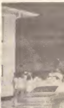
Accionnan na A. stus...